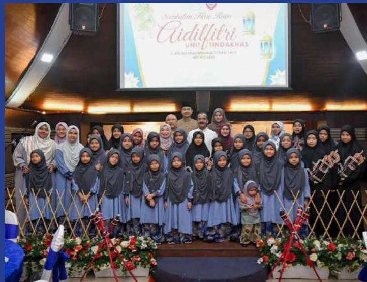
Kuala Lumpur, 21 April 2024 - Ketua Polis Negara (KPN), IG Tan Sri Razarudin Husain berbesar hati ke Majlis Sambutan Hari Raya Aidilfitri anjuran Unit Tindakhas (UTK) bagi tahun 2024 dekat Mes Pegawai Kanan Bukit Aman.