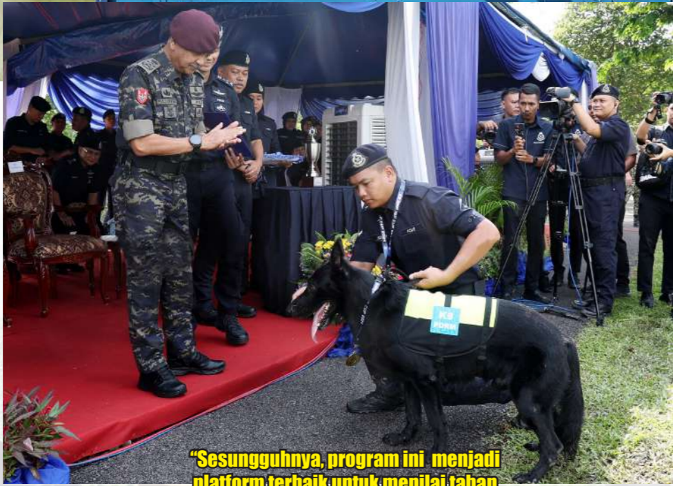
"Sesungguhnya, program ini menjadi platform terbaik untuk menilai tahap kecekapan pemegang-pemegang anjing sekali gus boleh dijadikan kriteria untuk kenaikan pangkat para handler"