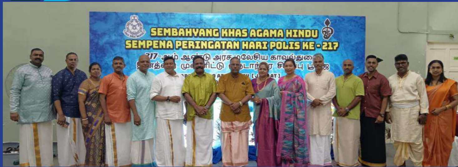
Kuala Lumpur, 19 April 2024 - Bersempena Sambutan Peringatan Hari Polis Ke-217, warga Polis Diraja Malaysia (PDRM) yang beragama Hindu melaksanakan sembahyang khas di Kuil Sri Maha Muniswarar dekat Pusat Latihan Polis (PULAPOL) Kuala Lumpur.