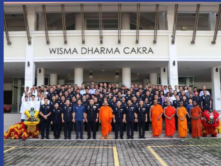
Kuala Lumpur, 26 April 2024 - Hampir 200 warga Polis Diraja Malaysia (PDRM) termasuk pegawai awam dan pesara polis beragama Buddha menyertai acara sembahyang khas sempena Sambutan Peringatan Hari Polis Ke-217 di Buddhist Maha Vihara Brickfields.